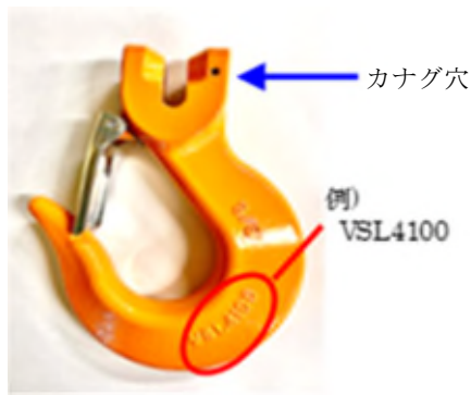
写真1 カナグの形式表示例